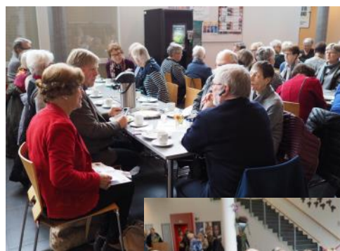
Bilder fra bespisning en i Operahuset.

Hjemveien ble også i år lagt om Grodås, hvor et godt måltid ventet på oss på Raftevold Hotell.